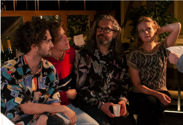
© Hubert Amiel, Sylvia, photos de répétition 2018