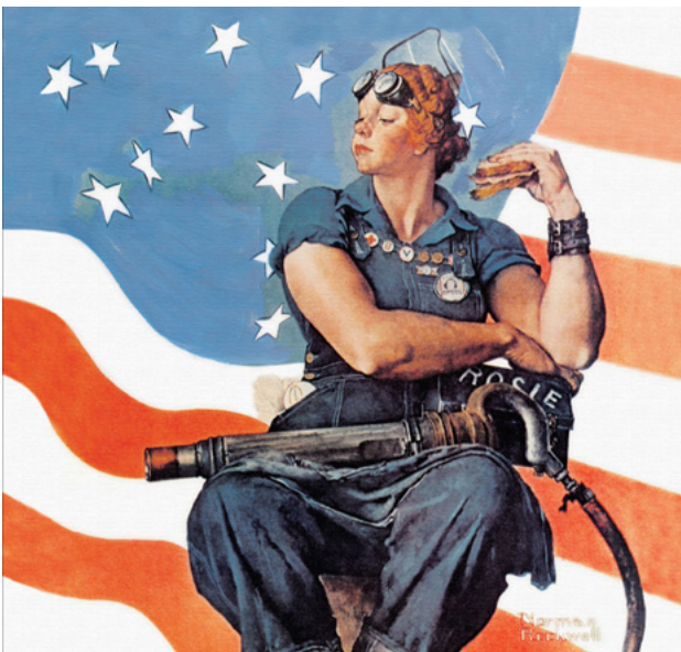
© Norman Rockwell, Rosie the riveter.

Dans de nombreux pays qui interviennent dans le deuxième conflit mondial, on peut voir les femmes prendre la place des hommes dans les industries, les entreprises, aux champs etc. Norman Rockwell peint à l'époque Rosie the riveter qui illustre cette image de femme forte, indépendante et qui prend la place des hommes même au niveau musculaire.