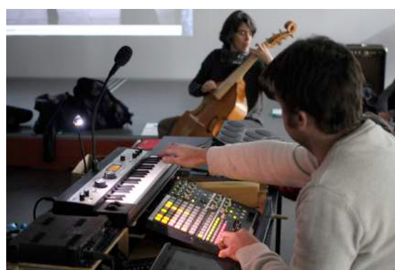
Décembre 2015 à LA MAISON DE LA MUSIQUE DE MEYLAN : Stage pour le CFMI de Lyon