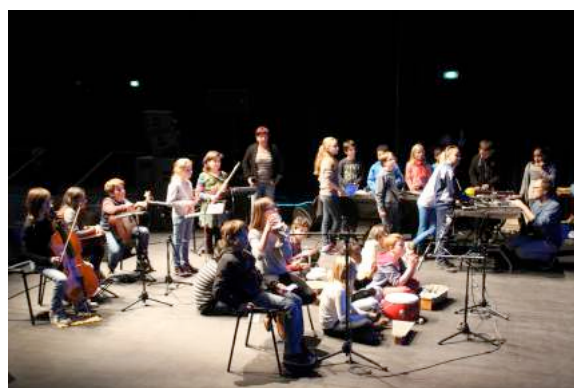
7 avril 2015 à LA BELLE ELECTRIQUE : Restitution de l'atelier ciné-concert

De plus, à présent reconnus comme des spécialistes du ciné-concert, ils interviennent en tant que formateurs sur cette discipline à destination de professionnels de la musique (intervenants en milieu scolaire, musiciens) et de pédagogues.