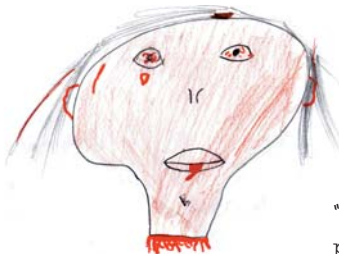
"La tête décapitée" par Delia